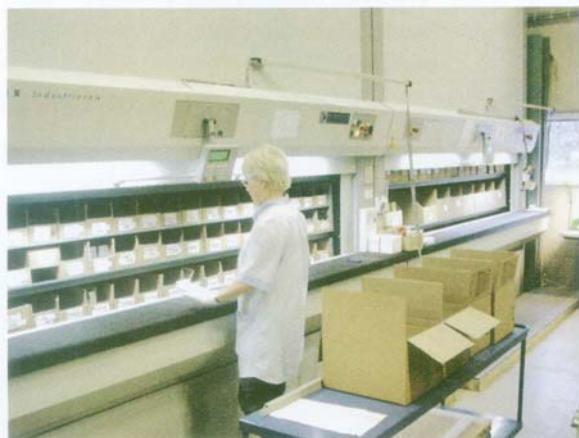
O Kardex Industriever Vertical Carousel é um dos principais sistemas comercializados pela Slidelog.